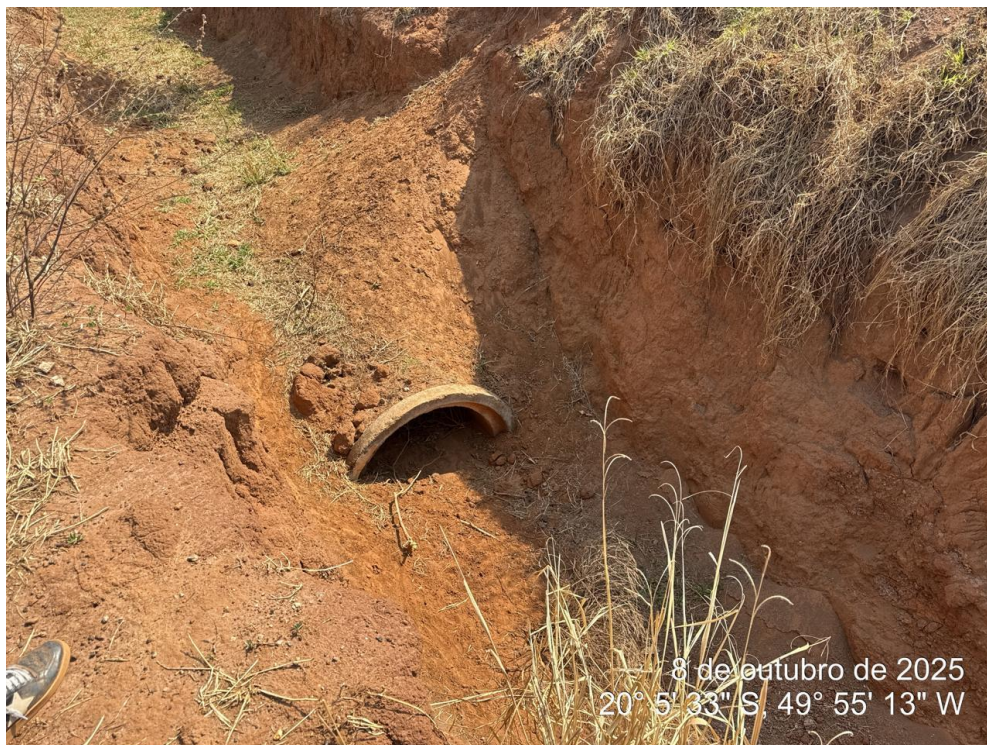
Foto 05: Segmento da galeria pluvial apresentando tubos desalinhados, desconectados, com material sólido no interior e sem execução de reaterro.