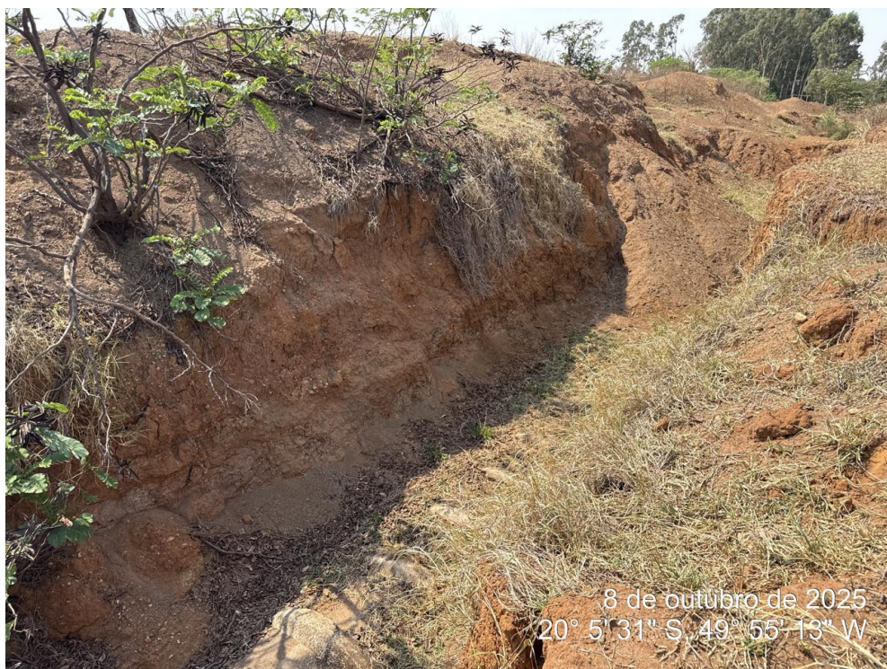
Foto 08: Outro ponto da obra apresentando ausência de reaterro e tubulação afogada, com risco de comprometimento estrutural e funcional do sistema.