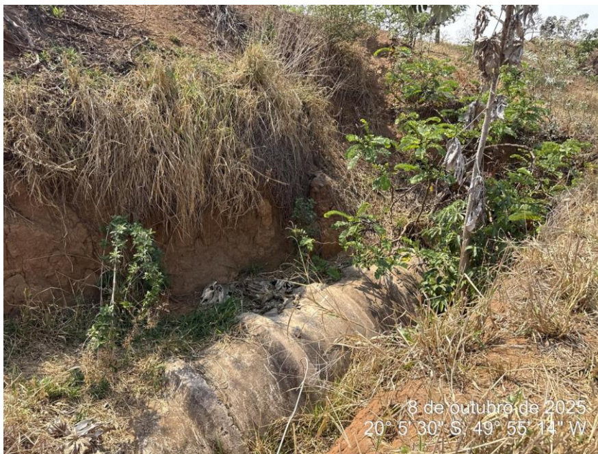
Foto 01: Trecho de linha de tubulação de drenagem pluvial executado, sem recomposição do reaterro e sem regularização do solo adjacente.

LOCAL: AVENIDA ROMEU VIANA ROMANELLI, ZONA RURAL – CARDOSO – SP.