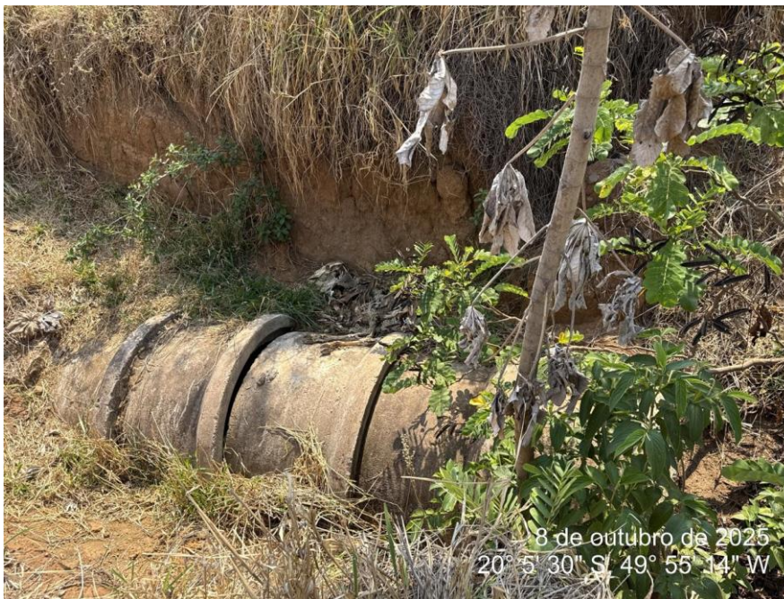
Foto 02: Tubulação de drenagem pluvial com juntas desconectadas, presença de material terroso no interior dos tubos e ausência de reaterro compactado.