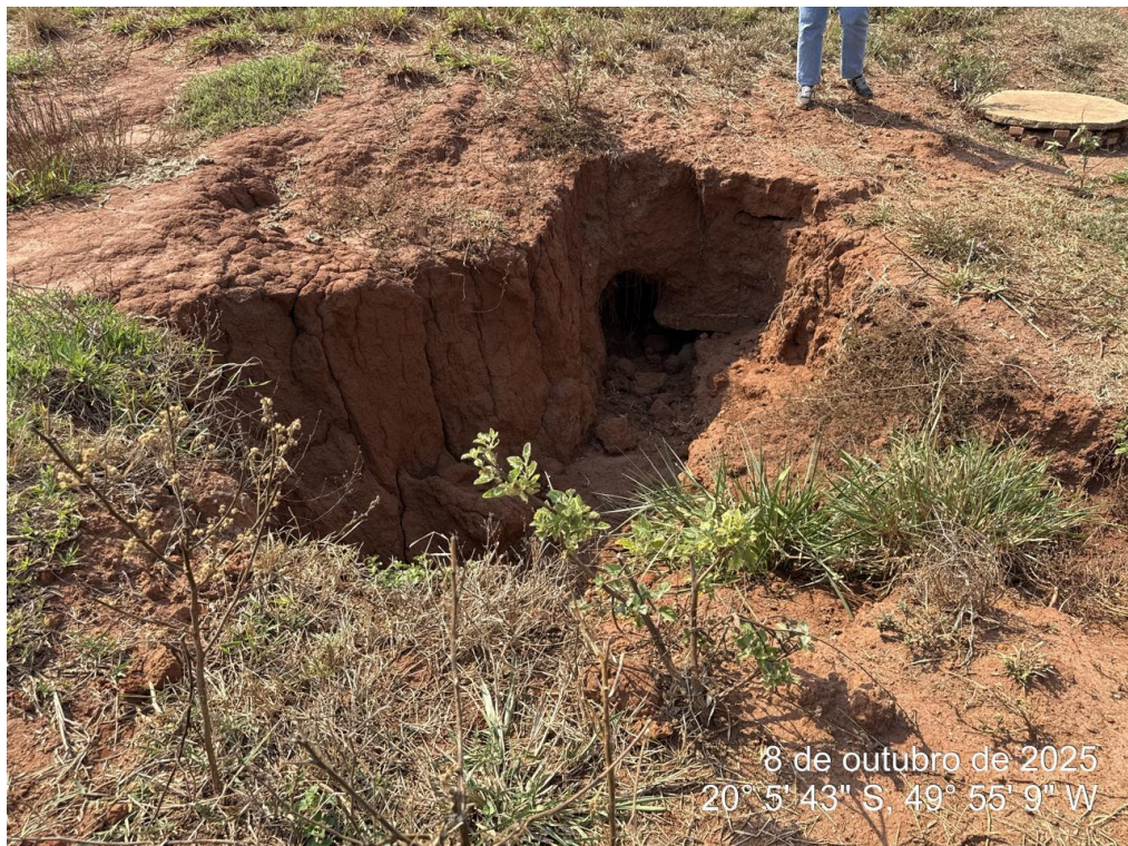
Foto 04: Processo erosivo identificado no entorno do poço de visita, indicando deficiência de contenção e ausência de recomposição adequada do terreno.