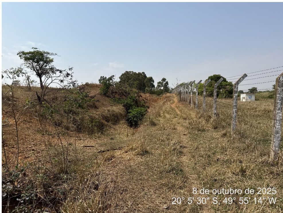
Foto 07: Trecho da galeria de drenagem sem reaterro, com tubulação parcialmente submersa (“afogada”), evidenciando falha de execução e drenagem inadequada.