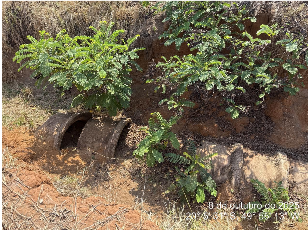
Foto 03: Detalhe de tubos de concreto desconectados, com obstrução por solo carregado e inexistência de reaterro de proteção.