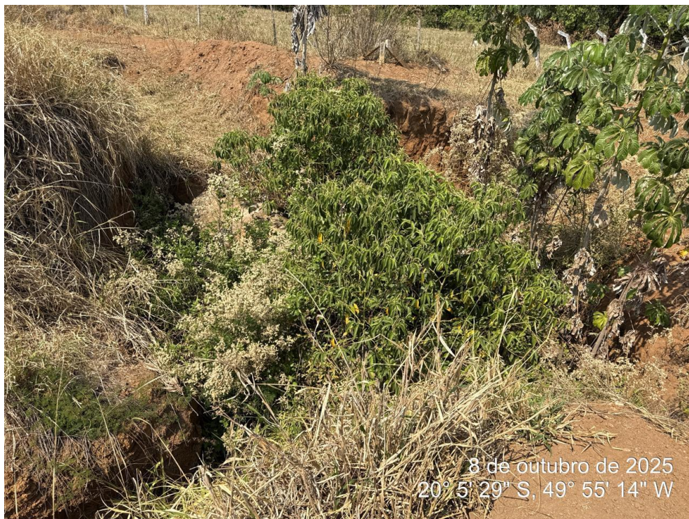
Foto 06: Poço de visita inacabado, sem fechamento ou acabamento final, com presença de vegetação invasiva no interior e entorno da estrutura.