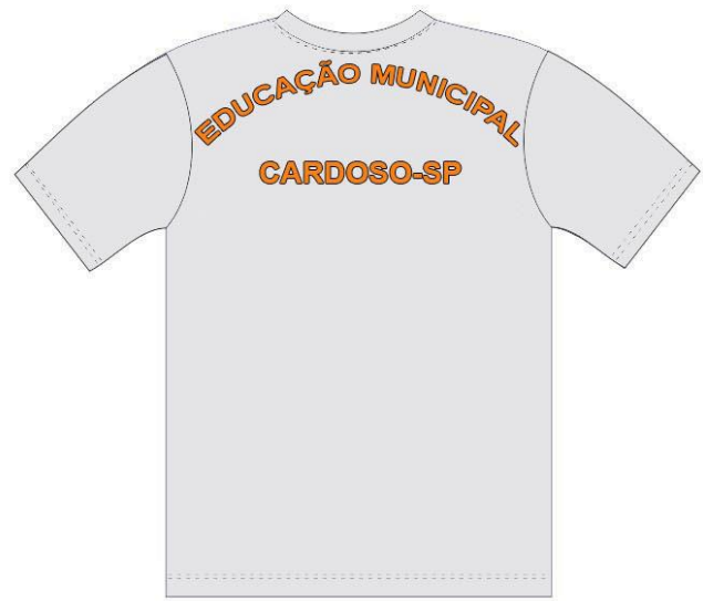
Tabela de Dimensões